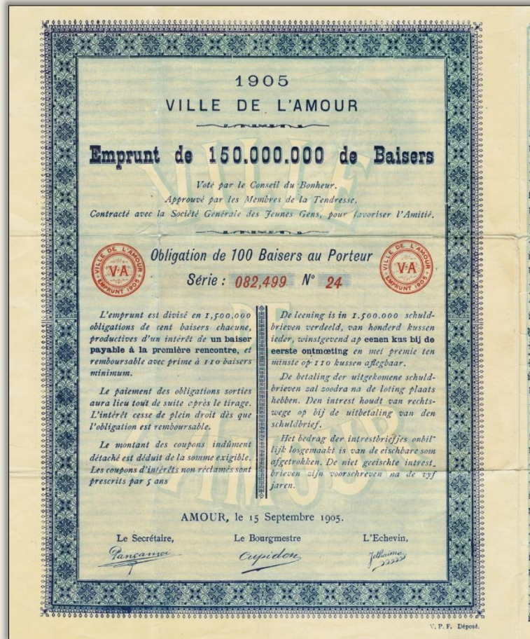
Stadt der Liebe, Obligation über 100 Küsse, 1905

Beide äußerst seltene Obligationen sind humorvolle Meisterwerke aus einer Epoche, in der das Zusenden einer solchen kuriosen Postkarte noch etwas Besonderes war, etwas was Menschen begeistern konnte.