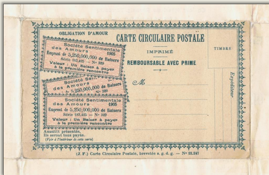
Rückseitig integrierte Postkarte

Am unteren Rand des Wertpapiers hat der Erfinder dieser Obligation sein Urheberrecht durch eine Warennummer schützen lassen. Der Clou an seiner Obligation: Sie kann in einer bestimmten Reihenfolge zusammengefaltet werden. Auf der Rückseite bleibt zum Schluss eine Postkarte übrig, die man dann an seine Liebschaft versendet. Die empfangene Karte kann dann wieder zu einer Obligation aufgefaltet werden. So sieht die rückseitig integrierte Postkarte aus: